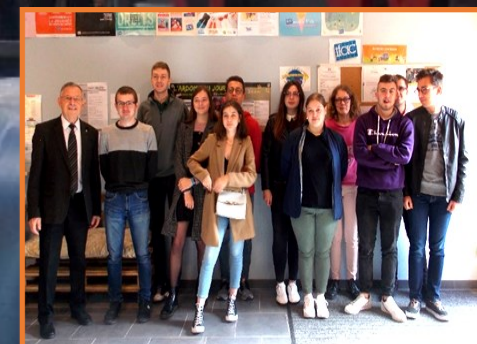
Cérémonie des Bacheliers