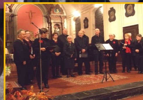
Concert pour les vitraux de l'église