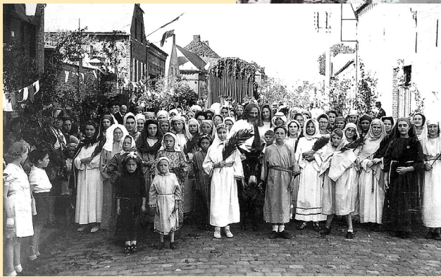
La chapelle de Saint Urbain, la formation de la traditionnelle procession et quatre chevaliers....

Ne cherchez plus la solution, elle est ici