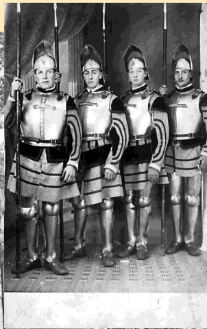
937. BUSIGNY — Chapelle Saint-Urbain